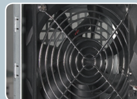
вытяжной 120 мм. вентилятор с низким уровнем акустического шума