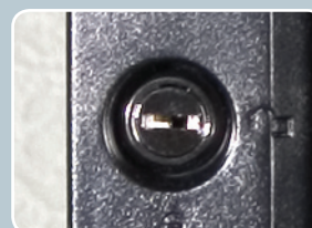
замок передней двери