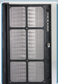
пылезащитный фильтр на двери корпуса